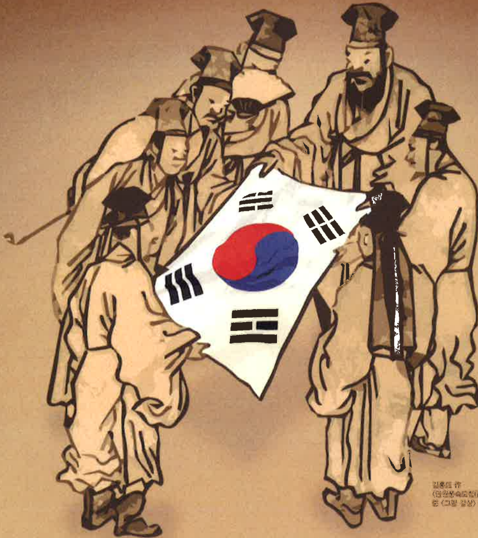
김홍도 작 (당나라의도화(唐國風圖帖)) 중 (그림 감상) 인문