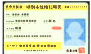
特別永住権証明書