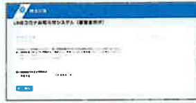
LINEコロナお知らせシステム 登録フォーム